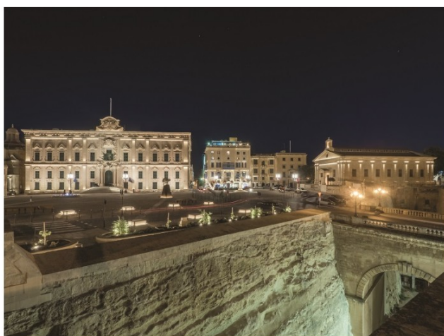
Piazza Castille a La Valletta, Malta